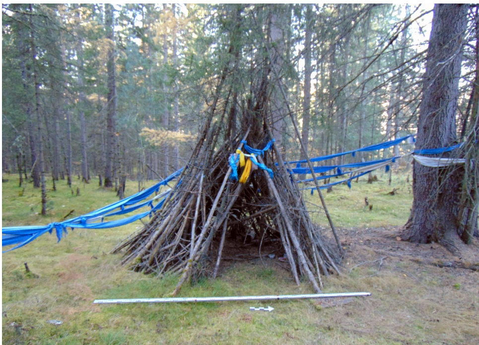
Рис. 4. Чумообразный шалаш, вид с востока