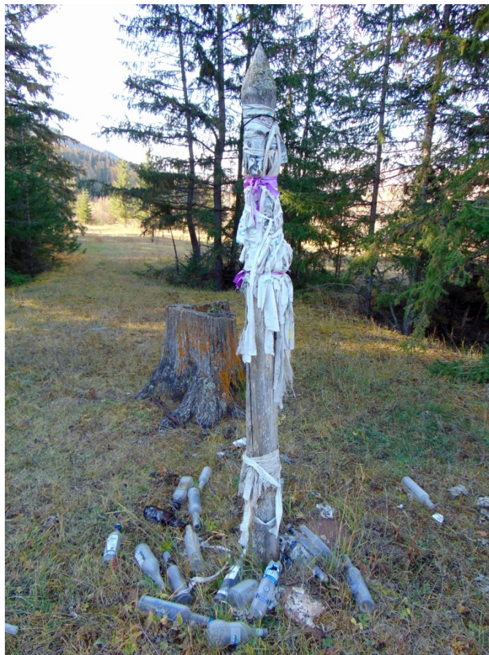
Рис. 2. Ритуальный столб (сэргэ), вид с севера

северо-западной стороны (рис. 3). Всего она имеет восемь углов, причем один из углов образован шалашом. Ленты преимущественно синего цвета, представляют собой связанные системой сложных узлов куски материи длиной около метра. Ленты повязаны в четыре ряда. Шалаш расположен справа от входа на поляну в ее северо-западной части, на ее периферии (рис. 4). Сложен из стволов небольших елок и еловых ветвей, наваленных на две рядом стоящие небольшие ели; имеет диаметр около 3 м, высоту около 2,5 м. Вход оформлен с восточной стороны четырьмя попарно прислоненными друг к другу небольшими стволами. Они связаны между собой короткими кусками материи синего, белого и желтого цвета. Внутри шалаша зафиксированы небольшая пиала, блюдо, пластиковая тарелочка, чайная ложка и пустая стеклянная банка. Конструкция имеет довольно грубое оформление, выраженное в общей неаккуратности постройки, неотесанности стволов, веточном навале. Также на поляне замечены следы коней, конский навоз, однако мусор и пустые бутылки отсутствуют.