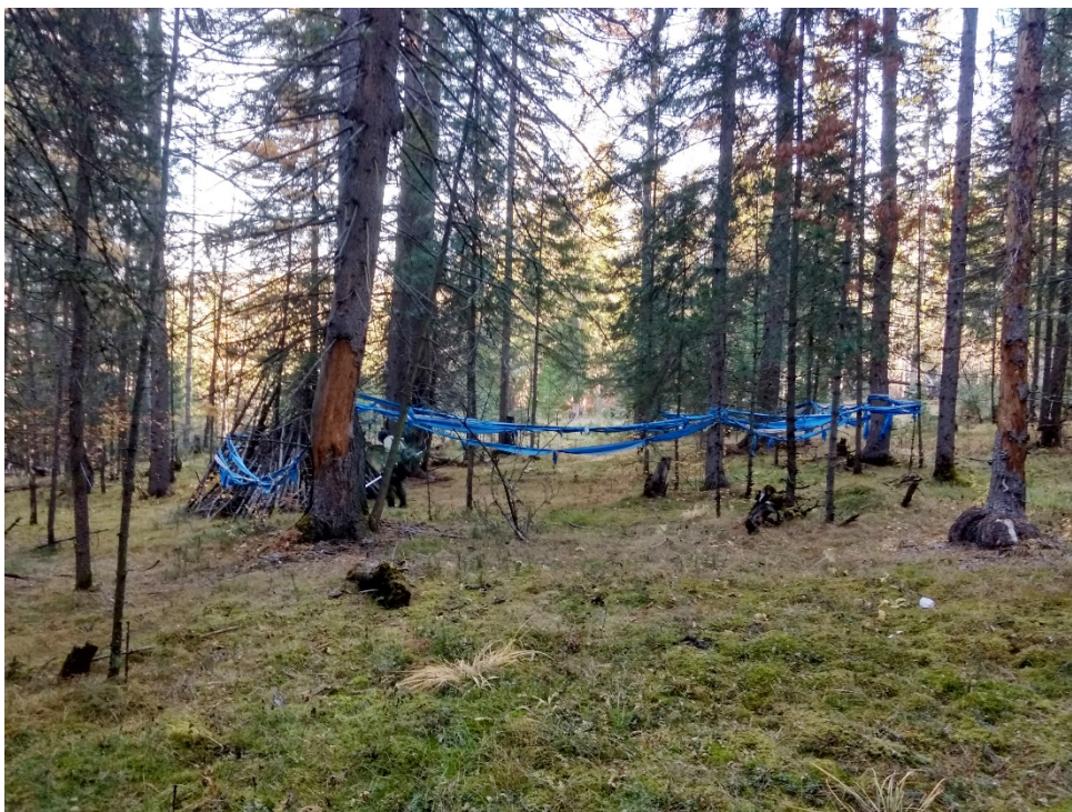
Рис. 3. Ритуальная поляна, вид с юго-востока