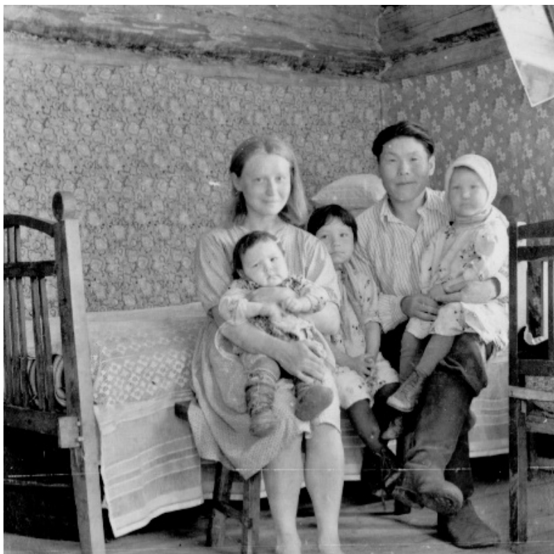
Рис. 2. Смешанная русско-эвенская семья, пос. Анавгай Быстринского района Камчатского края, 1957 г.