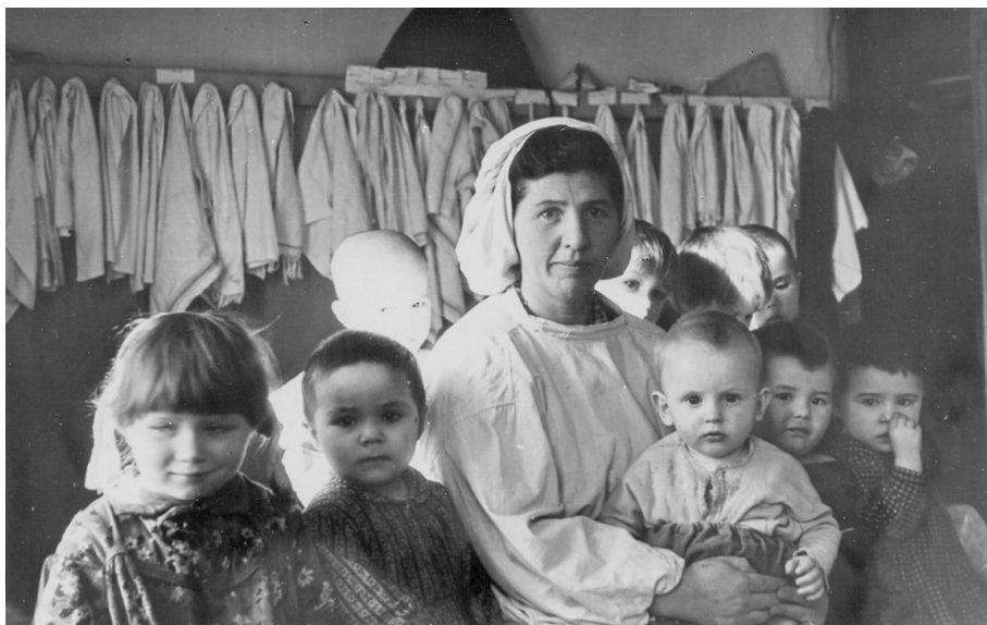
Рис. 3. Воспитанники детского сада-яслей с нянечкой, с. Тигиль Тигильского р-на Камчатского края. Экспедиция 1956–1957 гг. в Камчатскую и Магаданскую области, Верхнеколымский р-н ЯАССР. Фотоархив И. С. Гурвича. НИЦКП Национальной библиотеки РС (Я)