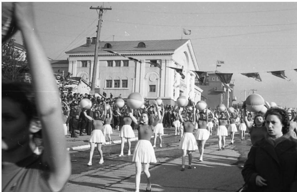
Рис. 1. Шествие молодежного парада. Петропавловск-Камчатский, 1957 г. Фестиваль молодежи.