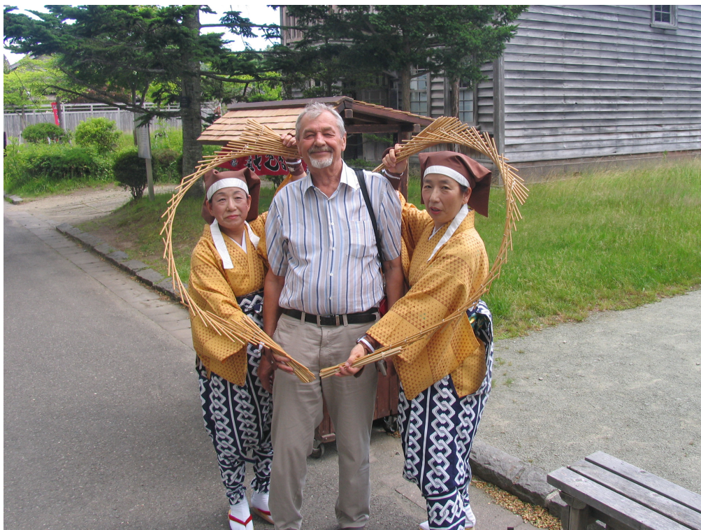
Рис. 10. Саппоро, Япония, 2011 г.