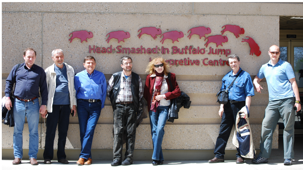
Рис. 7. Российские участники Российско-Канадского археологического проекта. Канада, 2010 г.