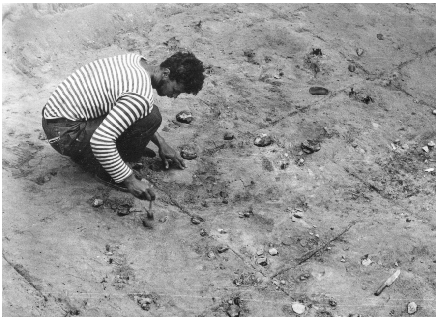
Рис. 3. Сосновый Бор, р. Беляя, 1969 г.