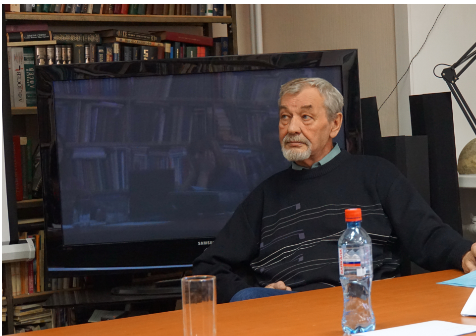
Рис. 9. Конференция «Евразия в кайнозой», г. Иркутск, 2014 г.