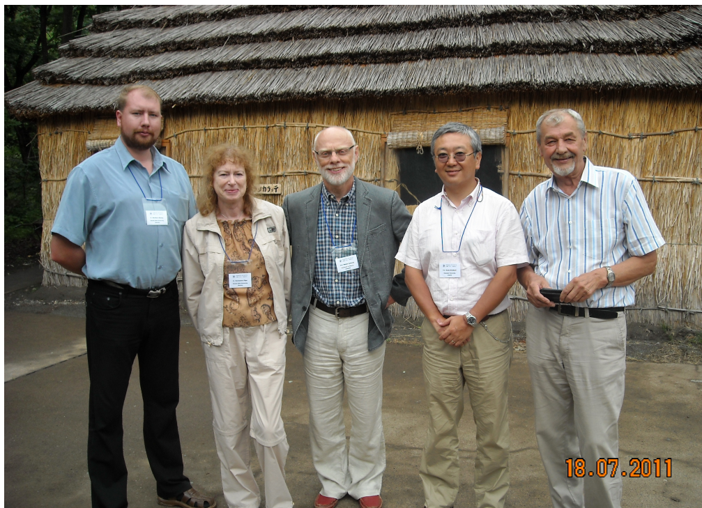
Рис. 8. Участники конференции по проблемам охотников-собирателей Северной Азии и Японии. Саппоро, 2011 г.