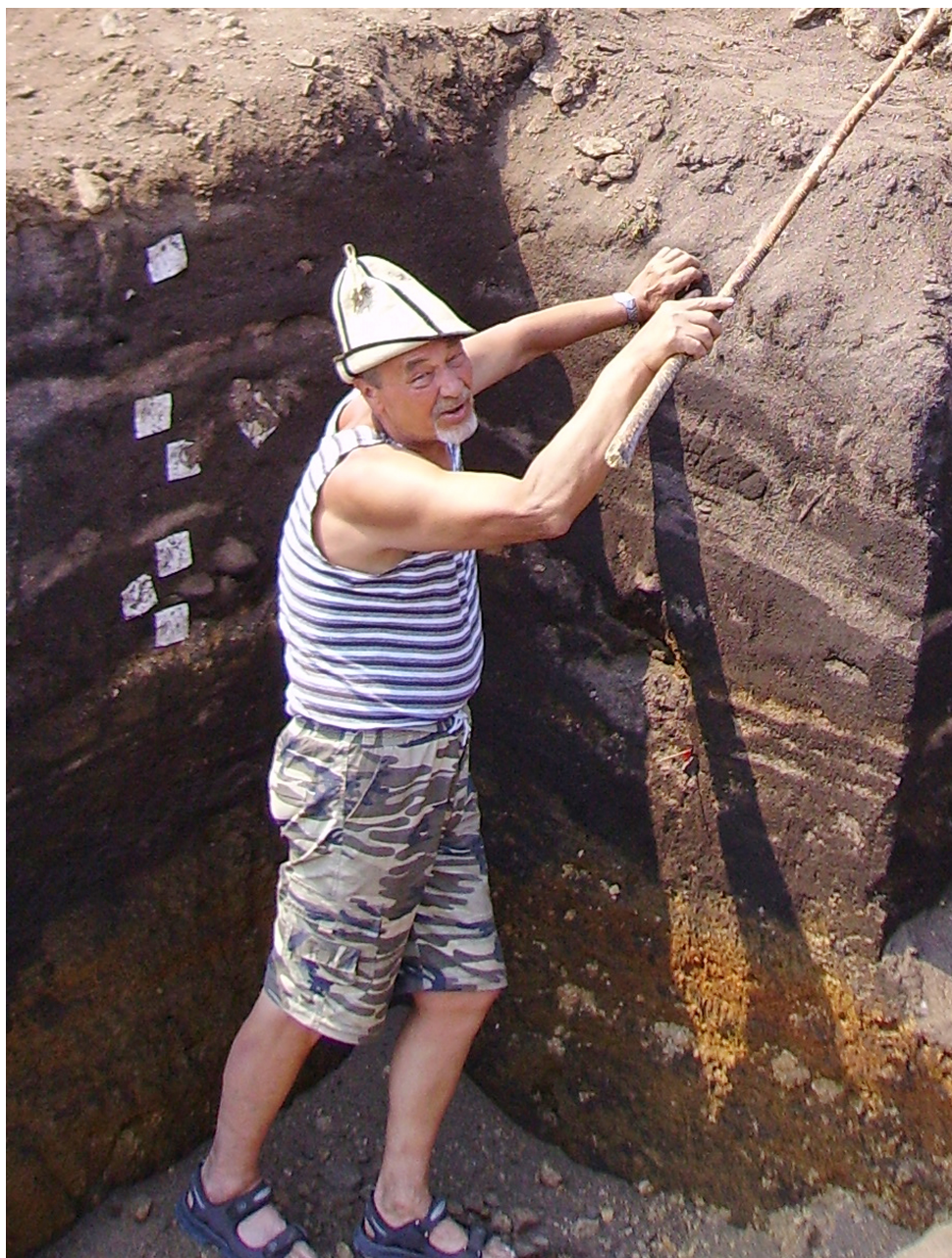
Рис. 6. Многослойная стоянка Бугульдейка II на Байкале, 2007 г.