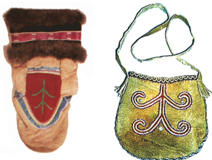
Рис. 3. Летняя обувь и сумочка из ровдуги с узором өнмиэдиэ [Жукова, 2011]