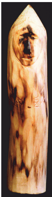
Рис. 4. Мужской остроголовый охранитель домашнего очага пэн йуойэ , дерево, мастер В. Г. Шалугин, с. Нелемное [ПМА 2; Жукова, 2011]. Из фондов Музея музыки и фольклора народов Якутии

Fig. 4. Male sharp-headed guardian of the hearth pen yuoye , wood, master V. G. Shalugin, Nelemnoe village [Author's field materials 2; Zhukova, 2011]. From the collections of the Museum of Music and Folklore of the Peoples of Yakutia