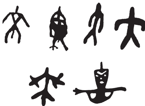
Рис. 1. Наскальные рисунки бассейна р. Лены [Окладников, Запорожская, 1972; Окладников, Мазин, 1976; Окладников, Мазин, 1979]

Остроголовые мужские и женские персонажи (рис. 2) прочерчены в женских пиктографических письмах на бересте конца XIX – начала XX в. [Иохельсон, 20056, с. 622, 623, рис. 71] и на бумаге в середине XX в. («Мысли стремятся к тебе, да не встретились мы») [Юкагиры ... , 1975, с. 56, 57]. Специфический абрис фигур людей интерпретируется вариативно. В. И. Иохельсон сравнил их со сложенным зонтиком; это компиляция орнаментальных мотивов шоромо ‘человек’ и шаал ‘дерево’ в тесной связи с культом предков [Жукова, 2012, с. 205–216].