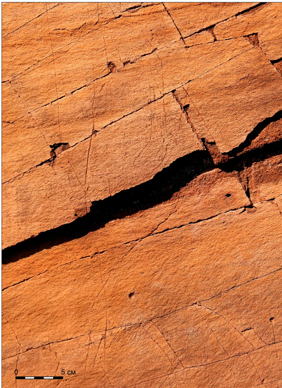
Рис. 2. Фотография фрагмента композиции памятника Улан-Байтог. В верхней части хорошо видна выполненная гравировкой нога северного оленя (?), в нижней части можно рассмотреть менее заметные очертания морды другого животного