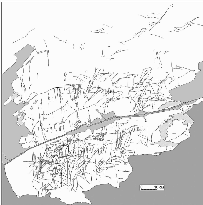
Рис. 4. Композиция памятника Улан-Байтог. Графическое воспроизведение (прорисовка) всех выявленных гравированных линий и границ утраченных фрагментов скальной корки

гие, с опущенными вниз головами, – влево. В левой верхней фигуре угадываются характерные черты северного оленя. Видовую принадлежность других определить затруднительно; скорее всего, это копытные, возможно олени или лоси. По стилю эти рисунки отличаются от известных петроглифов Кудинской долины и представляют интерес для уточнения хронологии наскального искусства этого района. Уже само состояние изображений обнаруженной плоскости (сильная патинизация и сглаженность линий) говорит о значительной их древности по сравнению с гравировками курумчинской культуры. Об этом же свидетельствует и образ северного оленя, совершенно не характерный для петроглифов долины Куды. По стилю же эти фигуры, на наш взгляд, можно сопоставить в некоторой степени с вышеупомянутыми древнейшими петроглифами Шишкинской писаницы, отнесенными выявившими их исследователями к эпохе позднего неолита (IV тыс. до н. э.) [Мельникова, Николаев, Демьянович, 2012, с. 85–88].