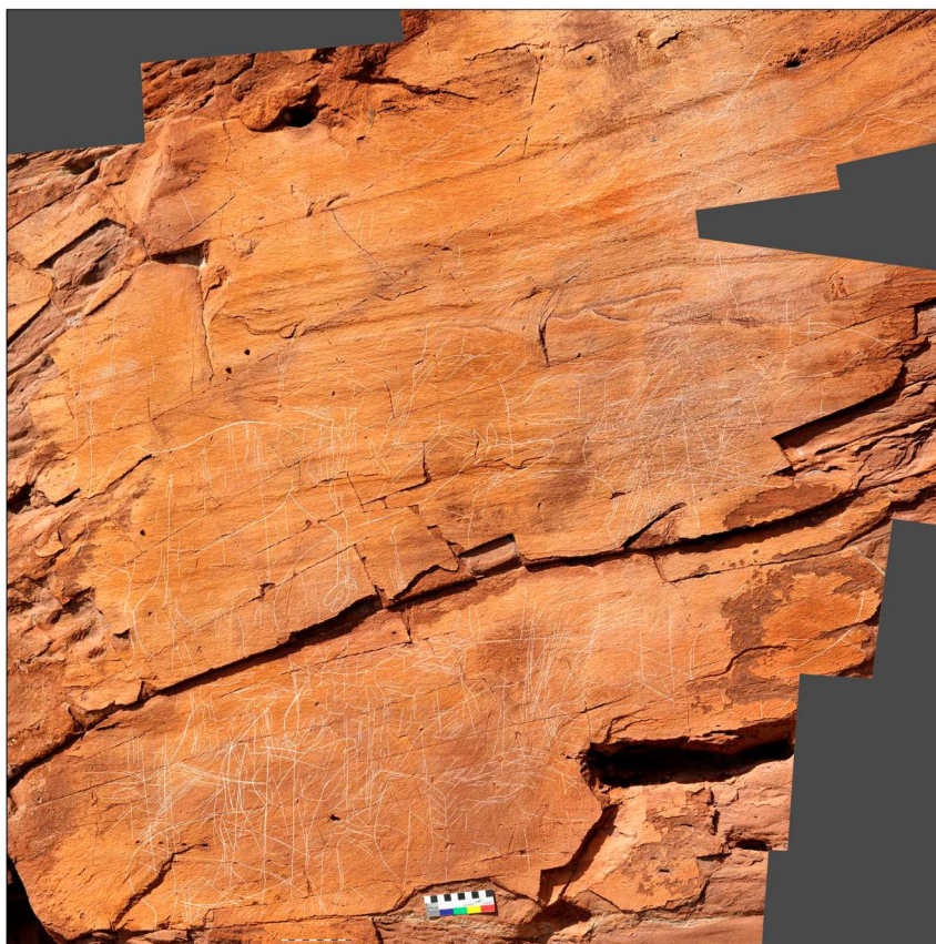
Рис. 3. Фотомонтаж, составленный из кадров – фрагментов плоскости памятника Улан-Байтог. Гравировки показаны в виде белых линий