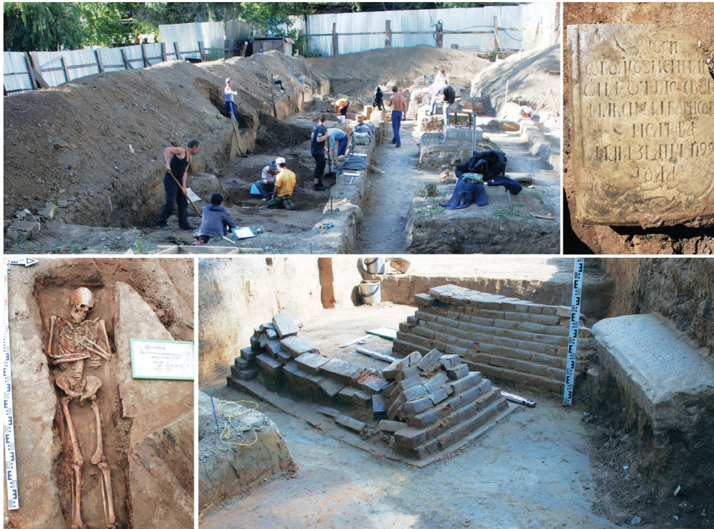
Рис. 4. Раскопки Крестовоздвиженского некрополя