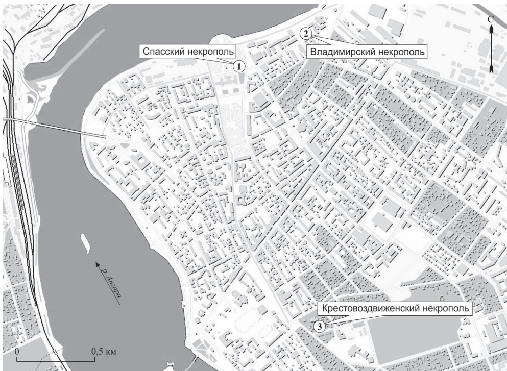
Рис. 1. Карта центральной части Иркутска с указанием расположения православных некрополей XVIII – начала XIX в.: 1 – Спасский некрополь; 2 – Владимирский некрополь; 3 – Крестовоздвиженский некрополь

В предлагаемой статье представлены и обсуждаются сведения по одонтологии и физическим характеристикам населения Иркутска XVIII – начала XIX в. на основе исследования двух репрезентативных серий, полученных в результате раскопок Спасского и Крестовоздвиженского некрополей (всего – 591 индивид).