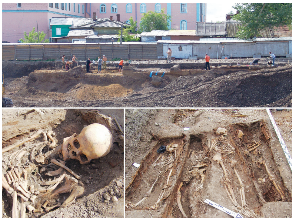
Рис. 3. Раскопки Владимирского некрополя