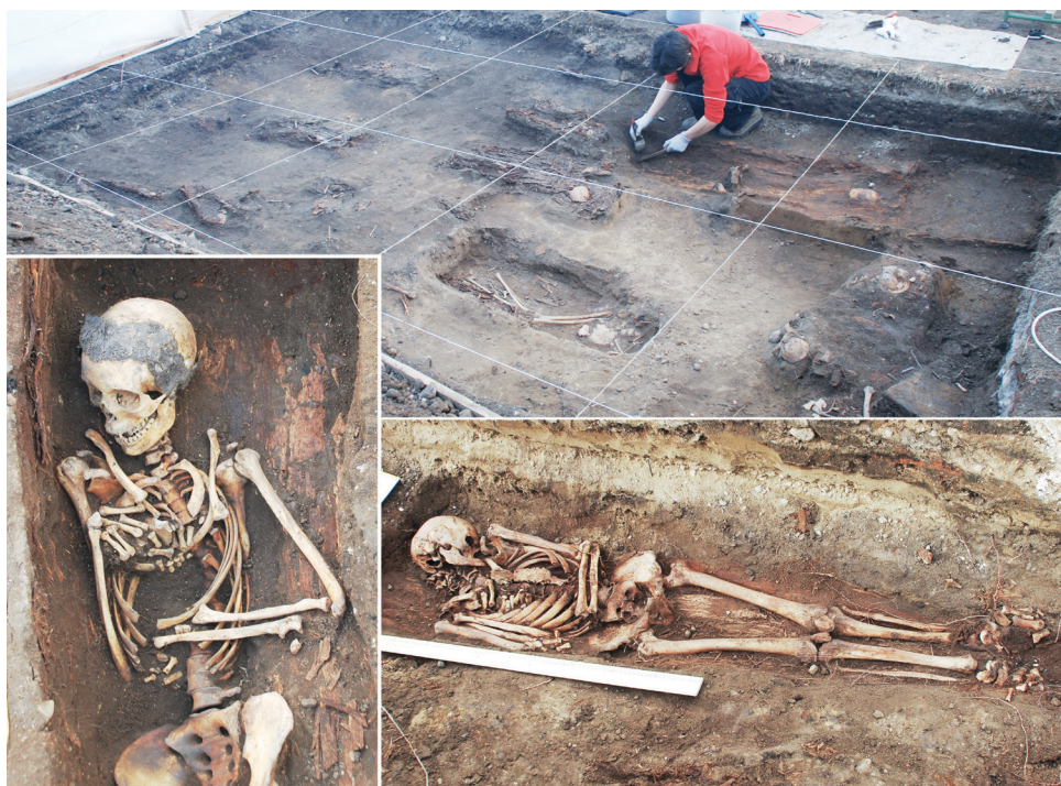
Рис. 2. Раскопки Спасского некрополя