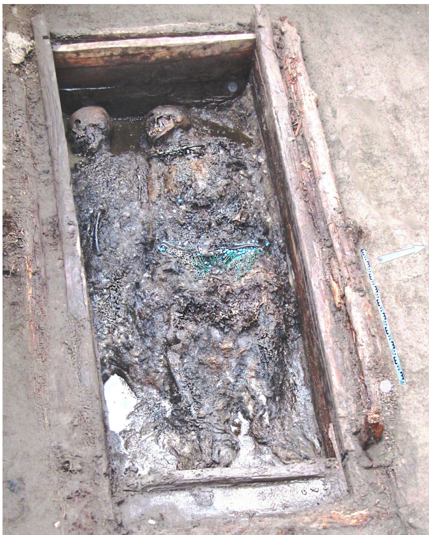
Рис. 4. Тысагастаах, парное захоронение ребенка 4–5 лет и взрослой женщины, не являющихся родственниками

но больше другой ( l-1 = 5,2 см, l-2 = 6,1 см) (рис. 5, 4, 5). В основном они типичны для большинства якутских женских захоронений XVII–XVIII вв. и считаются наиболее архаичными. Данная гривна, по классификации И. В. Константинова и А. И. Саввинова, относится к третьему типу (пластинчатых), выполнена методом листовой чеканки, имеет орнамент на лицевой стороне ( s листа = 0,3 см, d обруча = 21 см) (рис. 5, 2). Именно такие гривны в XIX в. становятся неотъемлемой частью главного традиционного якутского женского украшения – илин-кэлин кэбиһэр (с якут. – нагрудно-наспинное украшение) и в качестве самостоятельного атрибута в Центральной Якутии использовались уже редко [Константинов, 1971, с. 77–82; Саввинов, 2001, с. 33–39, 44–46].