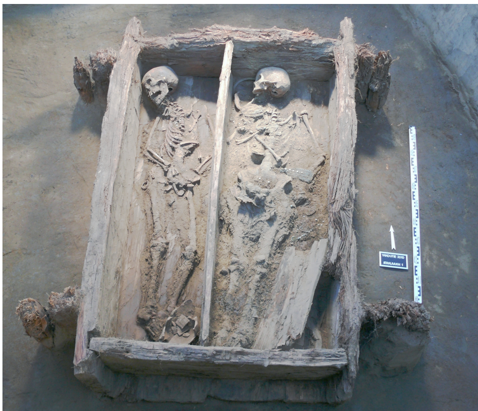
Рис. 3. Ыарыылаах, парное захоронение родных брата и сестры: мальчика 10–13 лет и молодой девушки 14–17 лет [Бравина, 2013, рис. 1; The genetics of kinship ... , 2016, fig. 4]

подростка (10–13 лет), покоящихся в общем гробу типа традиционного якутского холбó , сложенным из толстых лиственничных плах ( l = 148 см, b = 103 см, h = 32 см) и разделенном на два отсека продольной перегородкой [Бравина, 2013, рис. 1; The genetics of kinship ... , 2016, fig. 4] (рис. 3). Костяк девушки длиной 140 см расположен в правом отсеке, а мальчика, длиной 128 см – в левом. Оба костяка ориентированы головами на север, лицом обращены к западу, тела покоятся на спине, руки согнуты в локтях и изначально лежали на поясе (при этом левая кисть девушки затянута под подпружную пряжку бисерного пояса), ноги чуть подогнуты и упираются в южную стенку гроба. В ногах размещена деревянная погребальная посуда: у мальчика расколотый традиционный якутский кубок чорóн с резным орнаментом на вставной конусной ножке ( h кубка = 23 см, d тулова = 13,5 см) (рис. 5, 1), у девушки простая долбленная традиционная якутская чаша наподобие пиалы – кытыйá ( h чаши = 7 см, d венчиковой части = 17 см) (рис. 5, 11), а также железный нож в рукояти из капа березы ( l ножа = 26 см, l клинка = 15 см) (рис. 5, 10), причем любопытно, что ее сопроводительный инвентарь отгорожен от костяка дополнительной деревянной перегородкой [Кирьянов, 2011, с. 22–29, 66–70].