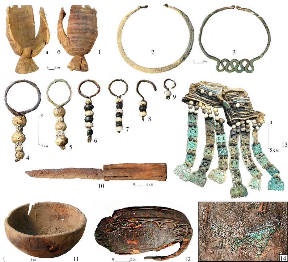
Рис. 5. Вещи и украшения из погребений Барыылаах (Ы) и Тысагастаах (Т): 1 – чорон для кумыса на вставной конусной ножке в двух проекциях (а – снаружи, б – изнутри) (Ы); 2 – пластинчатая шейная гривна (Ы); 3 – петлеобразная гривна с четырьмя изгибами (Т); 4, 5 – ушные серьги (Ы); 6–9 – ушные серьги (Т); 10 – нож в рукояти (Ы); 11 – кытыйа (Ы); 12 – кытыйа (Т); 13 – украшение «кыбака симэхэ» (Ы); 14 – украшение «кыбака симэхэ» [без масштаба] (Т)

Отсутствие в могильном заполнении углей говорит о том, что процесс погребения происходил в летне-осенний период, при этом лиственница, из которой были сделаны части могильной конструкции, по всей видимости, была заготовлена зимой: на месте продольного распила просматривается характерно ровная структура, без волнистости [см.: Степанов, 2007]. Добротная сработанность плах позволяет сделать вывод, что процесс изготовления гроба был неспешным либо выполнялся опытным мастером. Прочность конструкции получена в результате плотной подгонки концов плах в подготовленные пазы, сам гроб собирали непосредственно в яме. При этом отдельные огрехи все же имелись: зазор между крышкой и западной боковой стенкой прикрыли дополнительной плашкой, также для придания большей устойчивости поставили еще один пикет с юго-восточной стороны к двум имеющимся. Вмещающая сухая супесчаная почва обеспечила достаточно