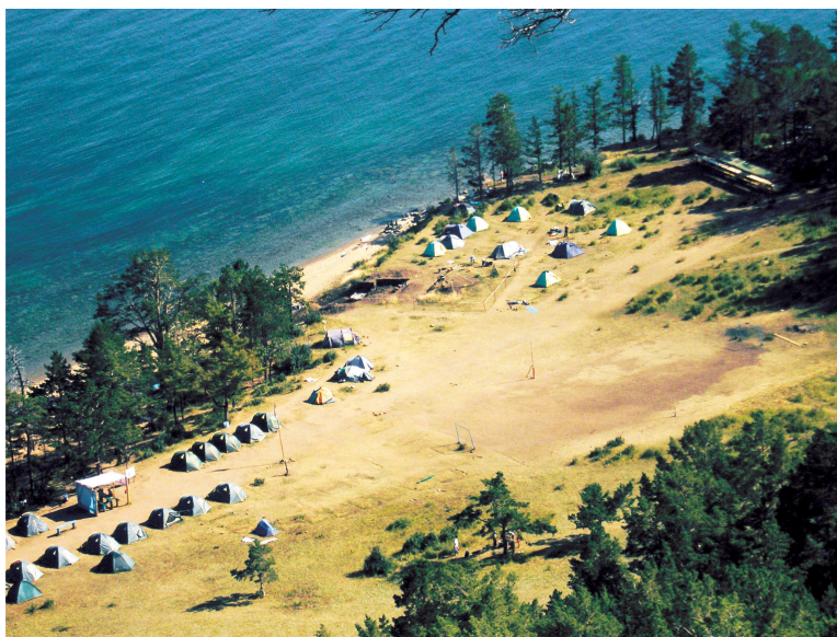
Рис. 2. Вид на бухту Ива (снято с севера)