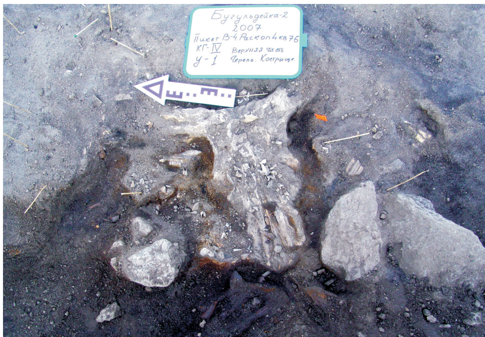
Рис. 3. Череп тура из раскопа № 4, кв. 76, слой IV (1)

В слоях раннего и среднего голоцена, ниже слоя II (3), остатки домашних копытных уже не встречаются, и слои в основном содержат остатки нерпы и диких копытных. Олени, кабан ( Sus scrofa ), а также рыбы представлены только несколькими фрагментами. Исключение составляет состав фауны из слоя IV (1), где найдено несколько фрагментов скелета тура Bos primigenius от одной особи (рис. 3). Они представлены частично сохранившимся черепом, зубами, одним фрагментом нижней челюсти и несколькими костями конечностей.