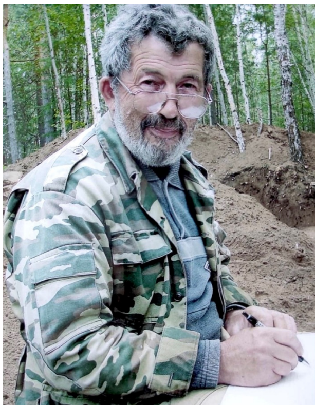
Богучанская экспедиция, Ручей Дубинский, 2012 г.