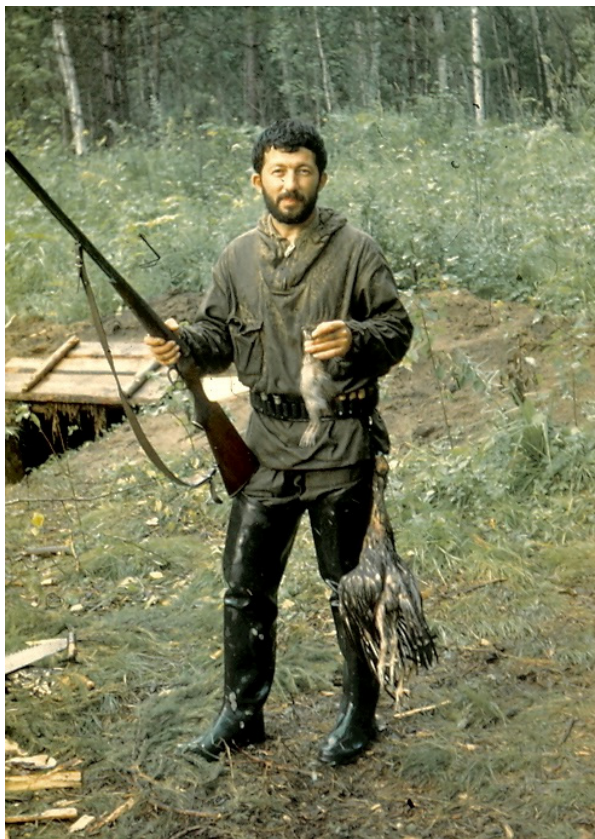
Потанчет, 1986 г.