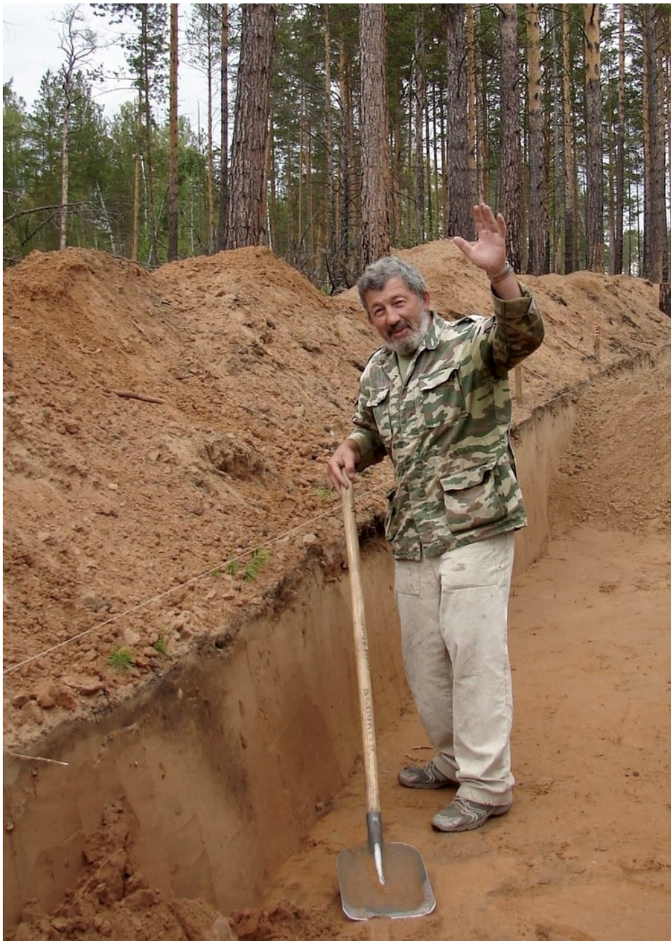
Стоянка им. А. Г. Генералова, р. Чуна, 2013 г.