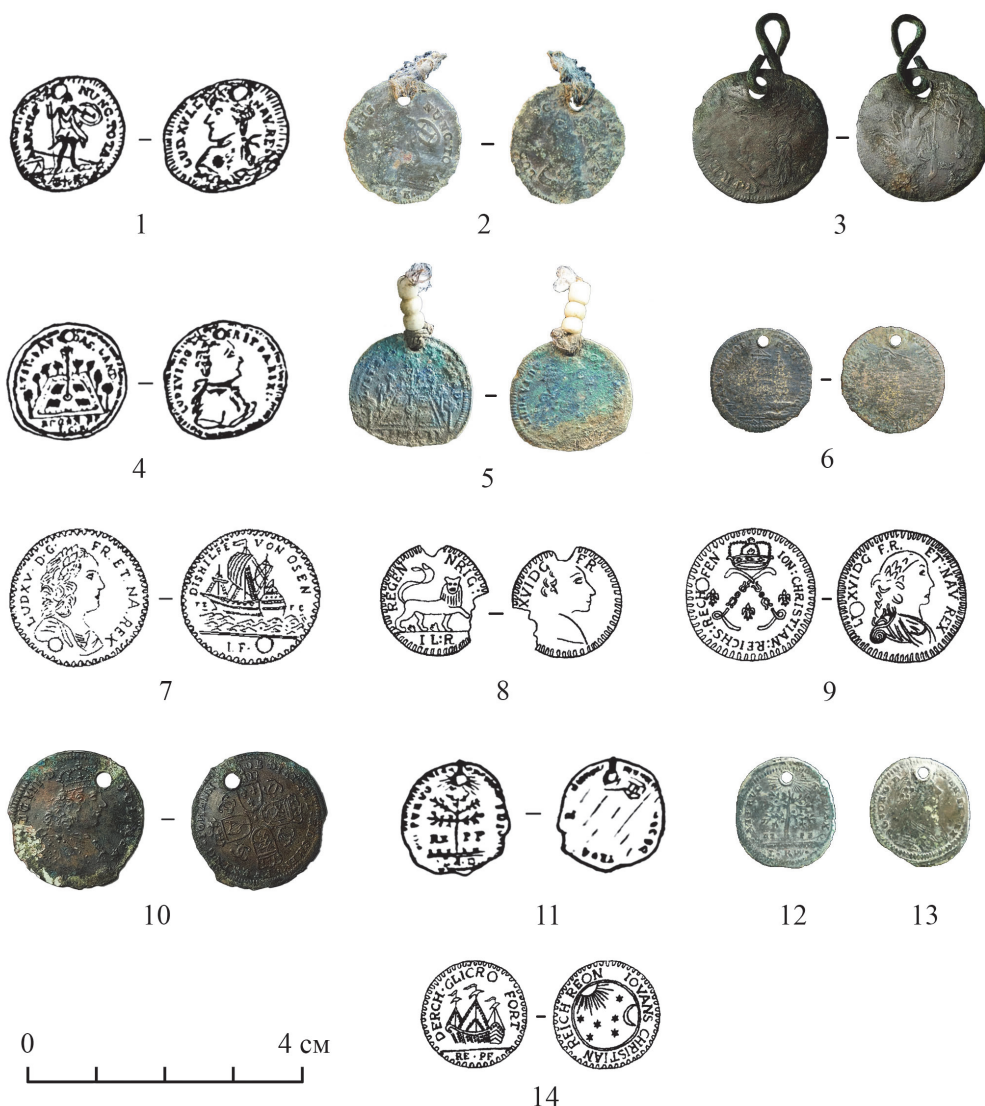
Рис. 2. Счетные жетоны из старобурятских погребений Приольхонья: 1–6, 10–13 – Тодакта IV; 7 – Мандерхан IV; 8, 9, 14 – Хагун I (1–3 – I тип; 4, 5 – II тип; 6, 7 – III тип; 8 – IV тип; 9, 10 – V тип; 11–13 – VI тип; 14 – VII тип)