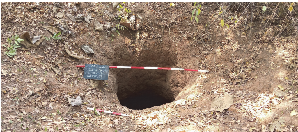
Рис. 3. Шахта для добычи руды (вход) на местонахождении Доссуэ (февраль 2021 г.)

Местонахождение Доссуэ – бывшая древняя шахта по добыче руды – было в значительной степени засыпано в результате урбанизации, и его местоположение было идентифицировано. Согласно собранной информации, на этом участке находятся еще два полностью засыпанных ствола шахты, которые теперь утрачены из-за интенсивной урбанизации, затрагивающей этот район. Обследование позволило нам не только определить местоположение шахтовых стволов, но и выявить другие, которые все еще видны в ландшафте территории. Хотя растительность препятствовала тщательному исследованию этого участка, было обнаружено еще десять ходов шахт с видимыми отверстиями (рис. 3).