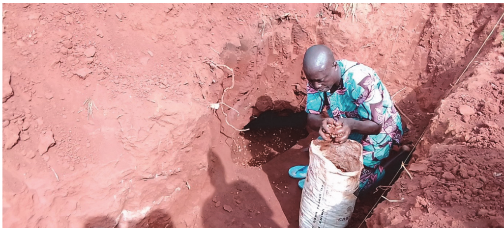
Рис. 5. Торговец собирает раковины каури из раскопанного сооружения в Абомее (фото И. А. Кудакпо, ноябрь 2020 г.)