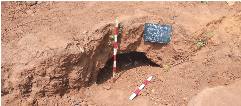
Рис. 2. Остатки сооружения, расположенного на городище Тенме (фото И. А. Кудакпо, февраль 2021 г.)

Fig. 2. The remains of a structure located on the Tenme hillfort (photo by I. A. Kudakpo, February 2021)