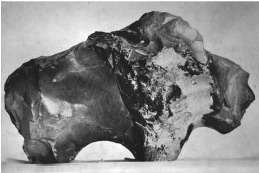
Рис. 7. Объемная кремневая фигурка бизона из Альстерталя [Matthes, 1963, Taf. 7.1]