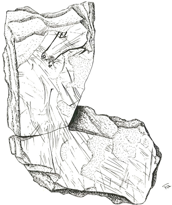
Рис. 6. Изображение головы оленухи из Заалека [Tautе, 1969, Taf. 13]

групп. Хотелось бы прояснить и временную перспективность данного сюжета: состоявшееся или же планируемое мероприятие? Но вряд ли подобного рода уточнения относительно палеолитического материала возможны. Отметим лишь экстраординарность самого события, связанного с необходимостью компоновки на одном небольшом полотне (даже с учетом его изначальных предполагаемых параметров) «канонического сюжета», выполненного тремя мастерами. Из понятных нам культурно-исторических практик мы можем сравнить его с «дипломатическим контактом», скрепленным авторскими изображениями предмета переговоров и действий относительно него – они договаривались о «лошади с рассеченной шеей».