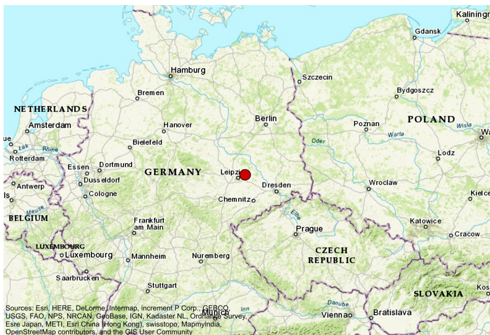
Рис. 1. Карта Центральной Европы с указанием расположения местонахождения Гройч

Культурно-хронологическая атрибуция комплекса проведена с опорой на орудийно-типологический характер его коллекции, насчитывающей к настоящему времени более 154 000 экземпляров каменных артефактов [Hanitzsch, 1972, s. 115].