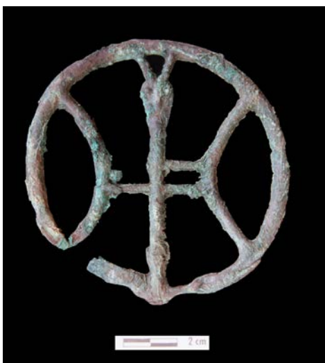
Рис. 3. Курма XI, ажурная бляха с антропоморфным изображением (погр. № 1)

По объему и качеству археологического и антропологического материала этот могильник является одним из самых крупных изученных некрополей раннего неолита Прибайкалья. В составе многочисленного сопроводительного инвентаря из китойских погребений, полученных из раскопок Российско-канадской экспедиции, обнаружено большое количество изделий мелкой пластики: рыбка-приманка, скульптурные головы лосей, уникальный стержень, оканчивающийся изображением головы нерпы (рис. 5, 6), и фрагменты от трех сосудов (один из них целый) с оттисками сетки-плетенки [Базалийский, Вебер, 2004, 2005, 2006].