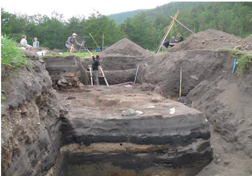
Рис. 9. Раскопки многослойного поселения Бугульдейка II