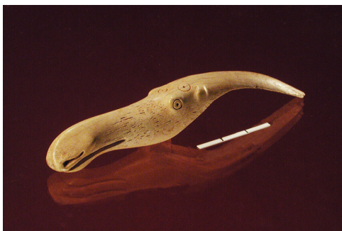
Рис. 5. Шаманка II, скульптурное изображение головы лося (погр. № 15)