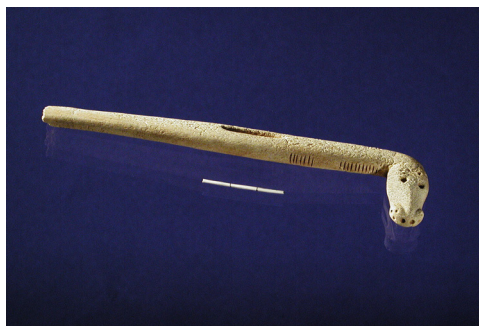
Рис. 6. Шаманка II, стержень с изображением головы нерпы (погр. № 18)

Объект Саган-Заба II ранее исследовался (1974–1975 гг.) Северо-Азиатской экспедицией ИИФФ СО АН СССР (А. П. Окладников). В результате было отмечено 5 культурных слоев. Раскопками Российско-канадской экспедиции выделено 11 культурных слоев (рис. 7, 8): VII слой отнесен к мезолиту; VI нижний, VI верхний и V нижний слои – к раннему неолиту; V верхний – к среднему неолиту; IV нижний и верхний – к позднему неолиту; III нижний – к бронзовому веку; III верхний – к раннему железному веку; II–I слои – к позднему железному веку – периоду этнографической современности. Впервые для территории Приольхонья на поселении выявлена дробная стратификация культуровмещающих отложений периода неолита и получена по ним представительная коллекция артефактов.