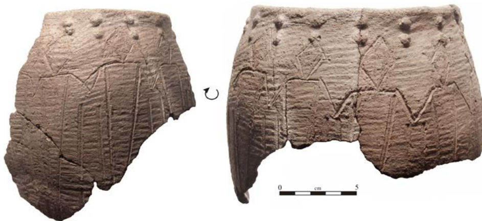
Рис. 4. Хадарта IV, фрагменты сосуда с антропоморфными изображениями (погр. № 4)