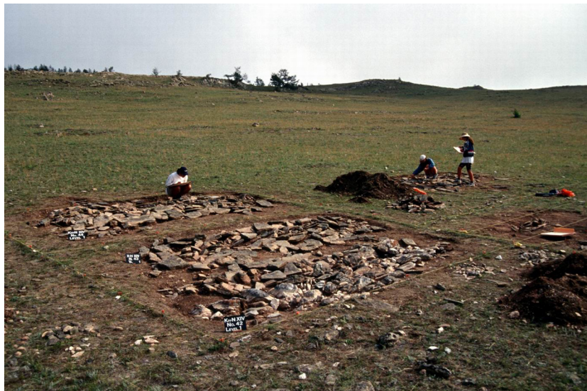
Рис. 2. Раскопки могильника Хужир-Нугэ XIV, вид на погр. № 42–48

2001 г.). В результате получены материал по 74 могилам и антропологические данные по 83 индивидам. Этот археологический объект является первым полностью вскрытым крупным могильником бронзового века на территории Прибайкалья. Выявлены важные материалы по погребальной практике и планиграфическим особенностям расположения захоронений на могильном поле (рис. 2) [Новиков, Горюнова, Вебер, 2005; Особенности погребального обряда ... , 2006; Khuzhir-Nuge XIV ... , 2008; Новиков, Вебер, Горюнова, 2010].