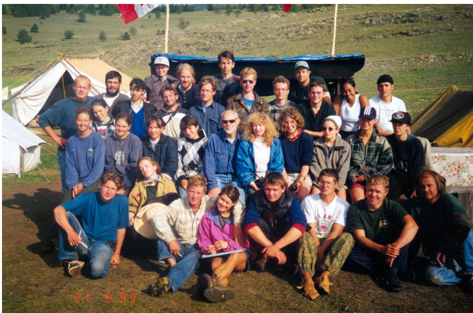
Рис. 10. Участники Российско-канадской экспедиции 1999 г. (бухта Хужир-Нугэ)

В рамках проекта проведена значительная работа по подготовке научных кадров. На базе совместной экспедиции проводились полевые школы для студентов и аспирантов из ИГУ и зарубежных университетов (рис. 10). Это способствовало установлению деловых контактов, усовершенствованию полевой методики и т. д. На материалах, полученных в результате совместных исследований, подготовлены и успешно защищены более 10 диссертаций, а также дипломные и курсовые работы как в России, так и за рубежом.