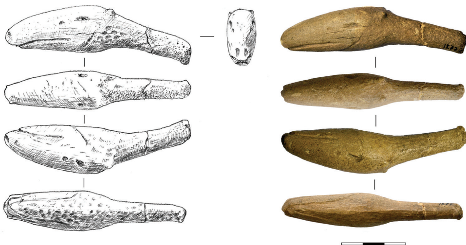
Рис. 4. Местонахождение Усть-Ёдарма II. Зооморфная скульптура – голова лося