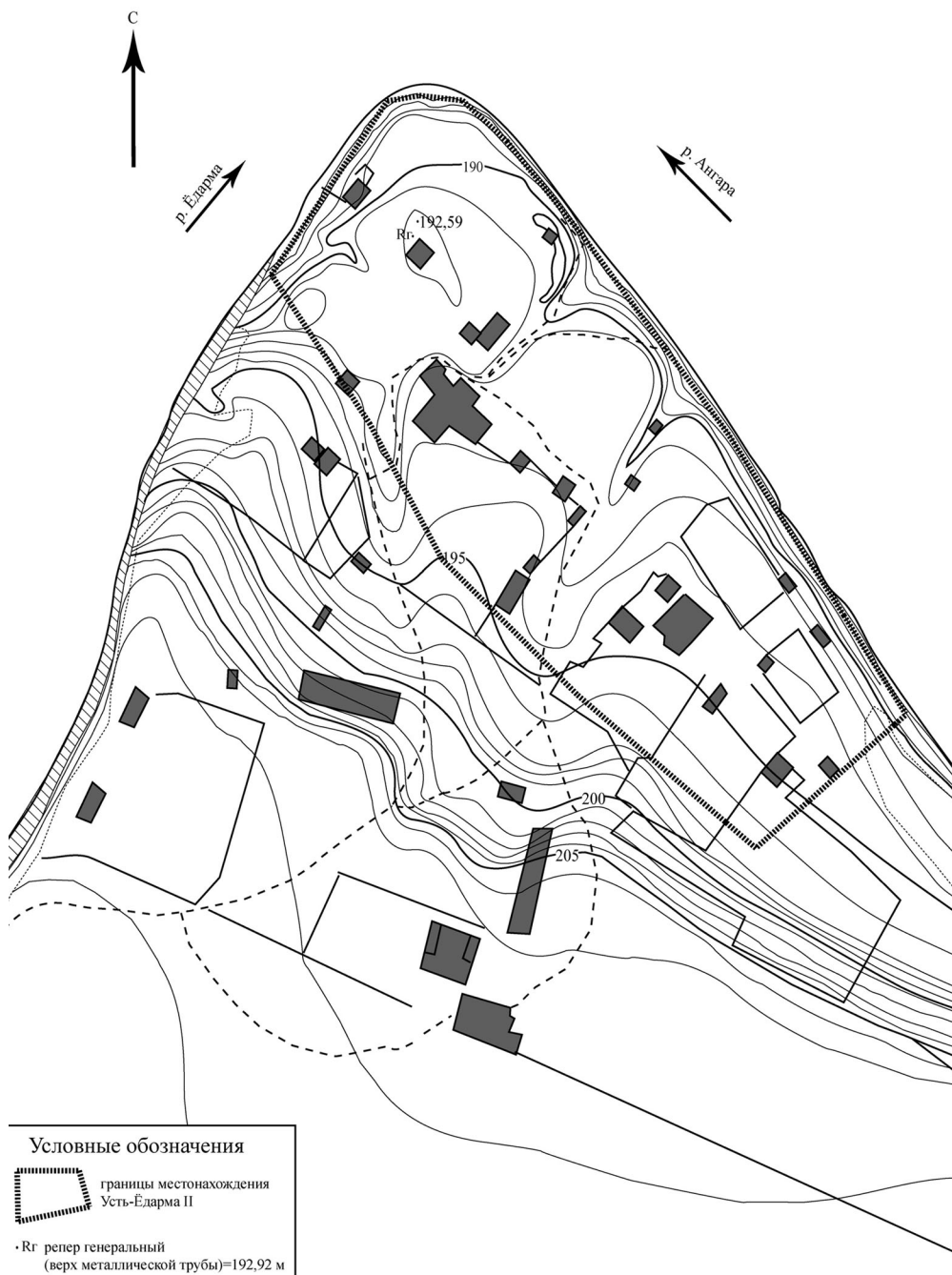
Рис. 1. Ситуационный план правого приустьевого участка р. Ёдармы с границами многослойного археологического местонахождения Усть-Ёдарма II