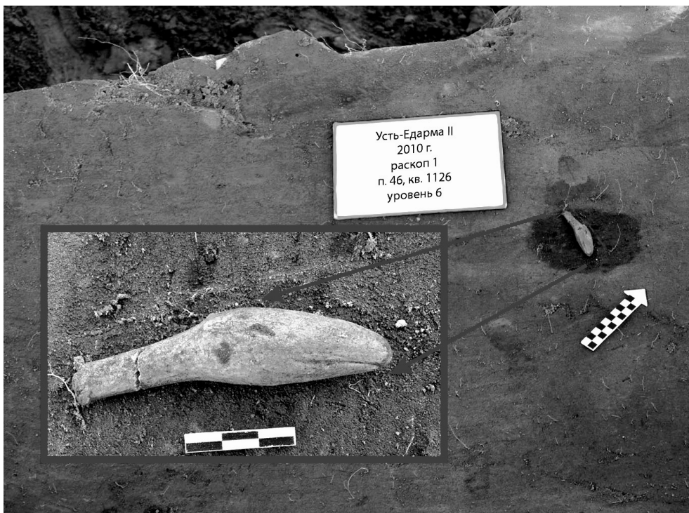
Рис. 3. Местонахождение Усть-Ёдарма II. Площадь А, раскоп 1, пикет 46, уровень 6. Зооморфная скульптура in situ